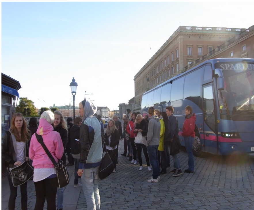
På väg till riksdagshuset. Första studiebesöket andra dagen.