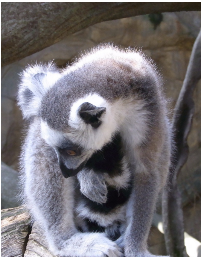
Lemur från Madagaskar.