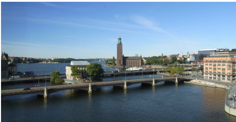
Utsikten från riksdagshuset