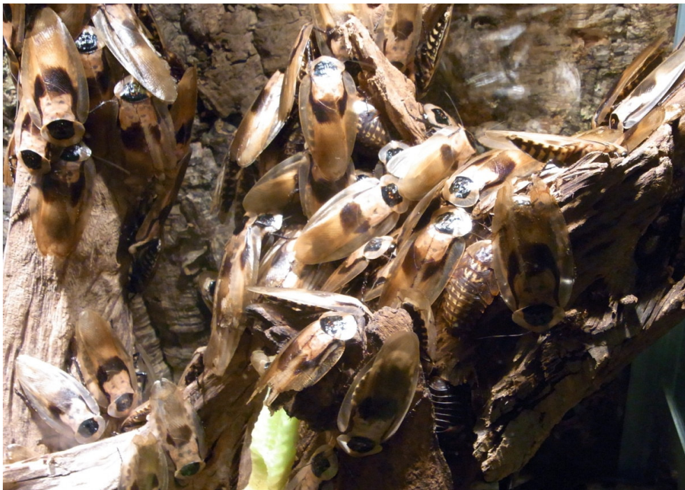
Kackerlackor i stora mängder.