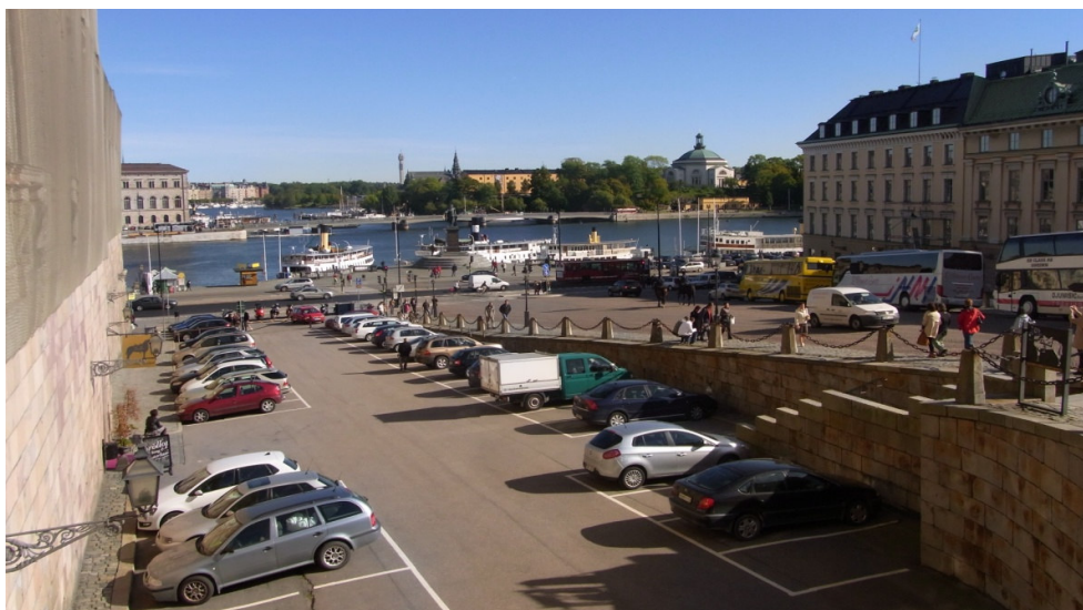
Utsikten från slottsbacken där vi samlades efter rundvandring på egen hand i Gamla Stan