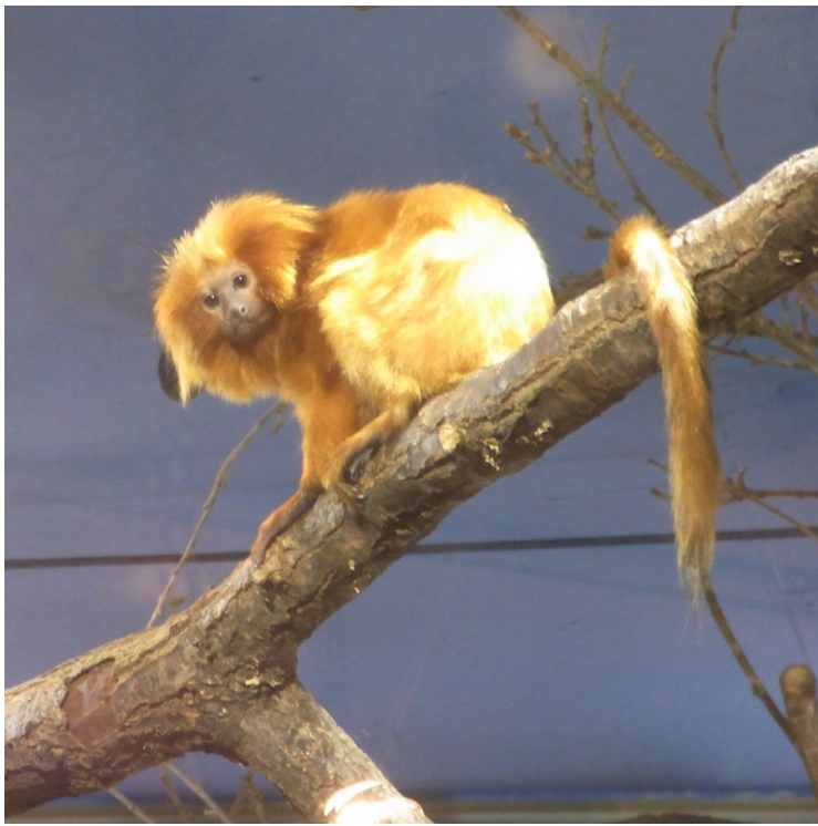
Lejontamarin från Sydamerika