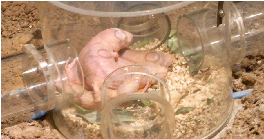
Nakenråttor från Östafrika. Ser ut som en kombination av rumpnissar och korvskinn.