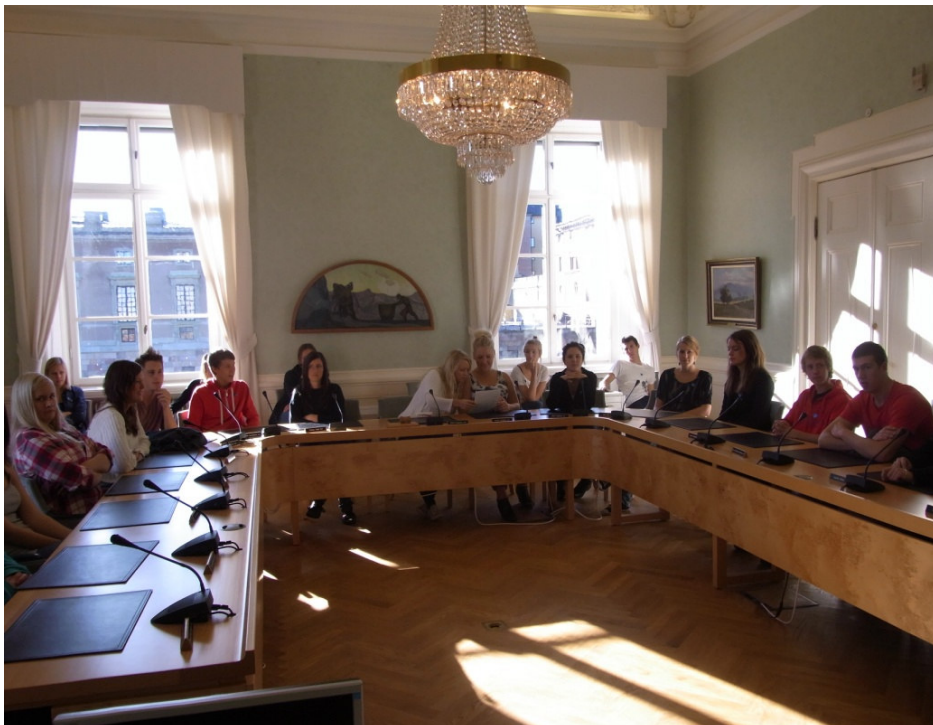
Blivande riksdagsmän sitter samlade i ett utskottsrum.