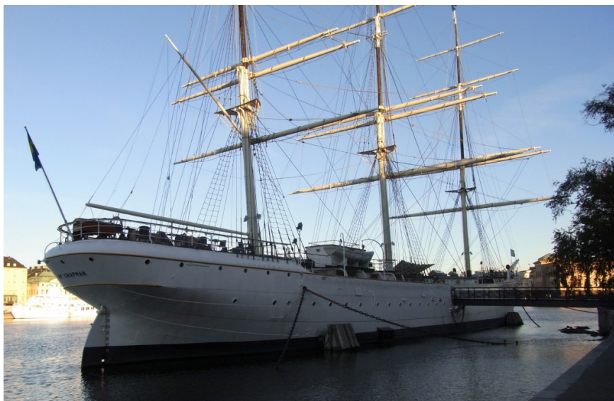
Kojplats förr NV3 men NV2 fick sova på land som riktiga landkrabbor