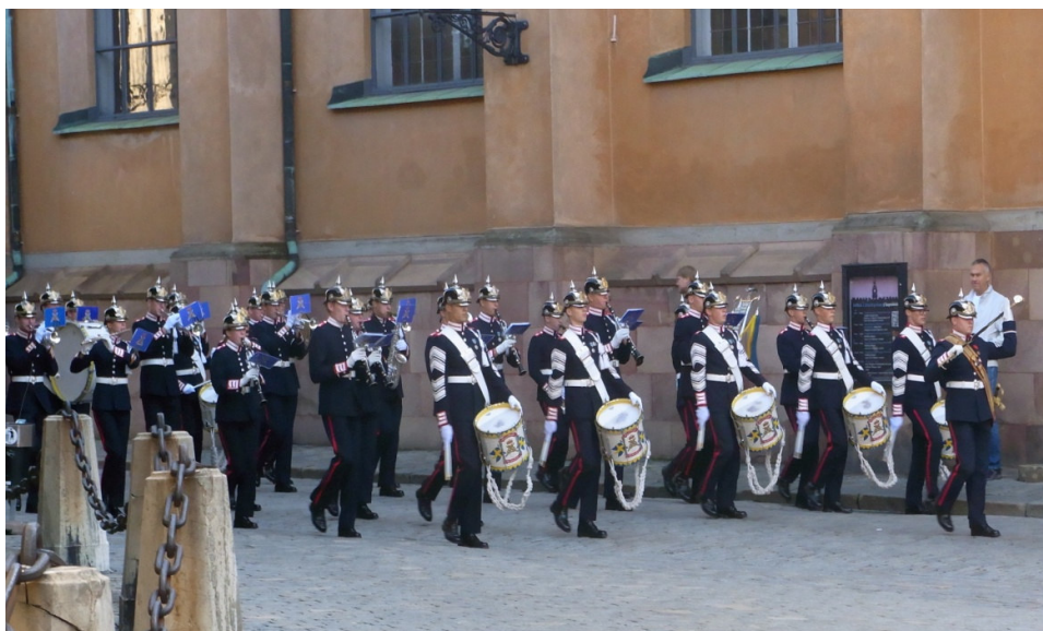
Vaktombytet på slottet hann några också att se.