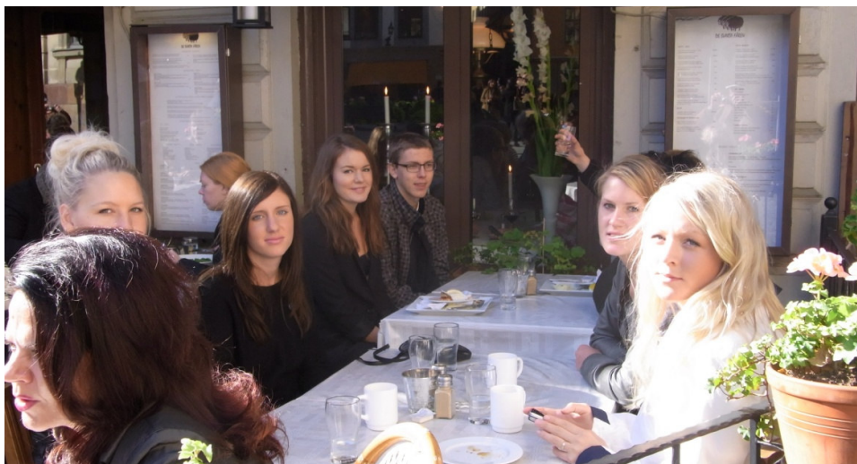
Gamla Stan fixade eleverna på egen hand.