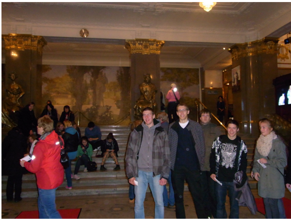
Våra förväntansfulla elever.