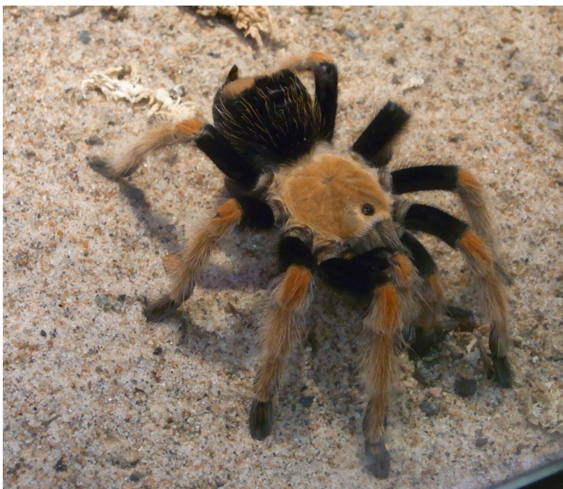
De hade en utställning av tallriksstora spindlar när vi var där.