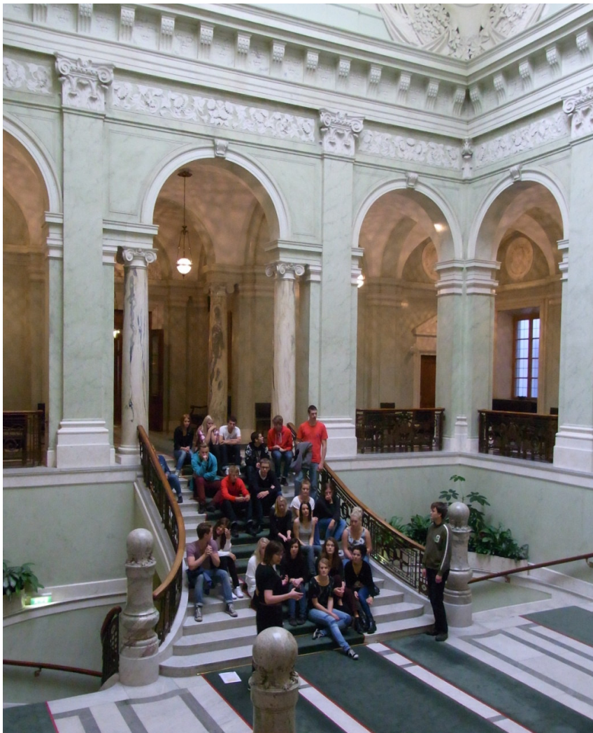
Samlade i entréhallen i den gamla delen av riksdagshuset.