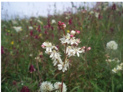
Figur 3. Tävlingsrutans miljö i midsommartid: backklöver, korskovall, brudbröd m fl.