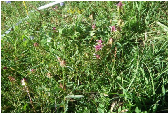
Figur 2. Blomprakt i rutan.