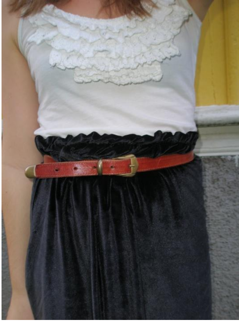
Kjol sydd av gammal klänning, linne och skärp second hand