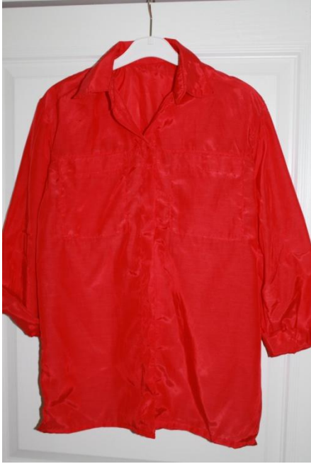
Skjorta sydd i viskos