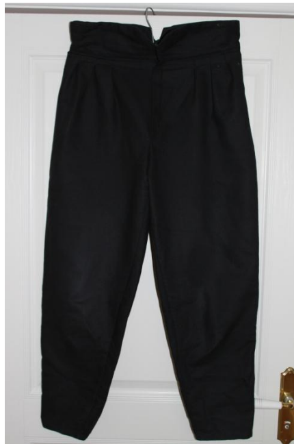
Byxor av gammal duk