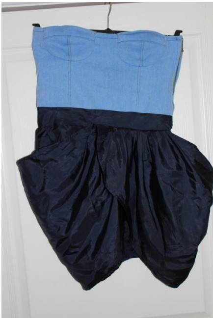
Klänning av gamla jeans och gardin