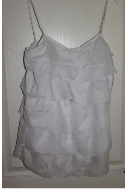
Linne sytt av gammal gardin