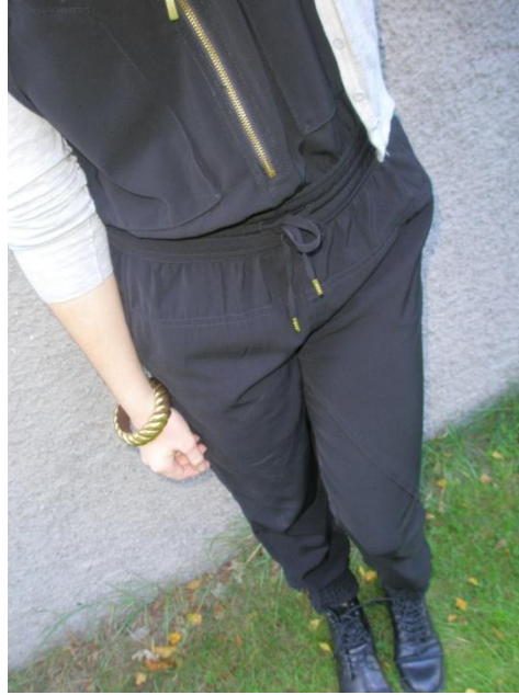
Byxdress köpt second hand