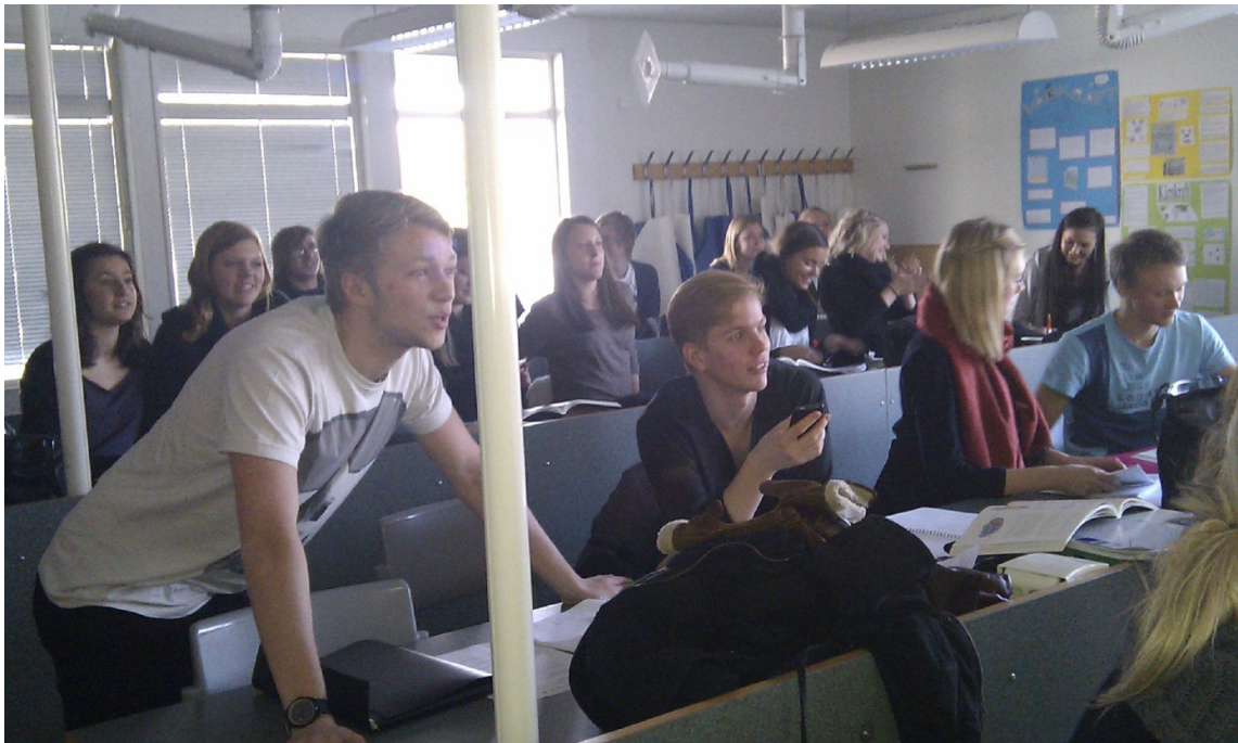
SP3. Elever med mycken stor uppmärksamhet.